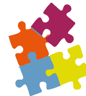
Atmosphère conviviale et ludique

Continuez la lecture pour en savoir plus sur notre offre !